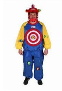
Full sticky suit