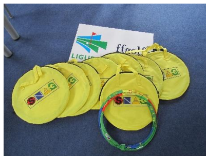
Hoop Clock 12 ans- Adultes