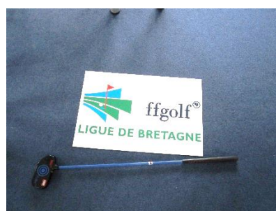
Roller Noir – Adultes