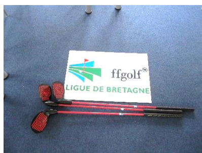
Launcher Noir – Adultes