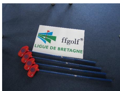
Roller Rouge – enfants à partir de 12 ans