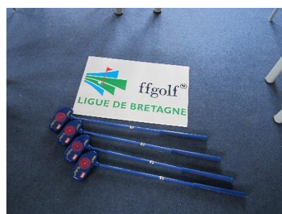
Roller Bleu – enfants de 7 à 11 ans