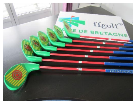
Launcher Vert – enfants de 4 à 7 ans