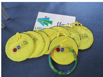
Hoop Clock 2-11 ans