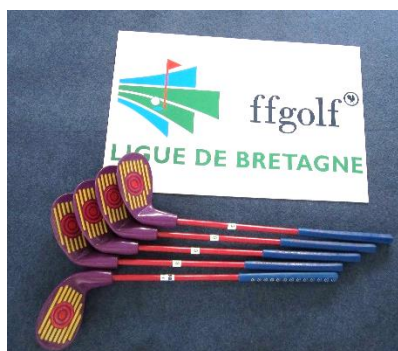
Launcher Violet – enfants jusqu'à 4 ans