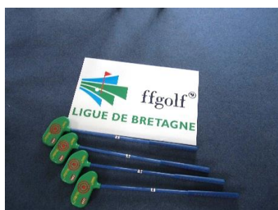
Roller Vert – enfants de 4 à 7 ans