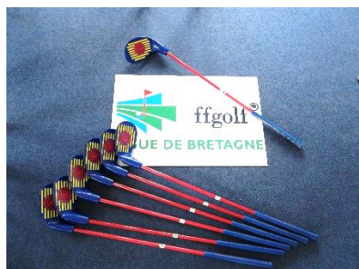
Launcher Bleu – enfants de 7 à 11 ans