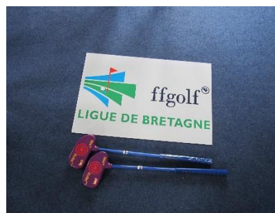
Roller Violet – enfants jusqu'à 4 ans