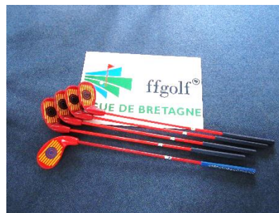
Launcher Rouge – enfants à partir de 12 ans